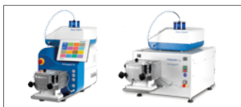
Farinograph-TS et Farinograph-E (USB) avec Aqua-Inject