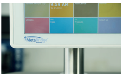
Écran tactile avec logiciel MetaBridge basé sur le web