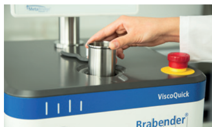
Récipients pour échantillons réutilisables en acier inoxydable